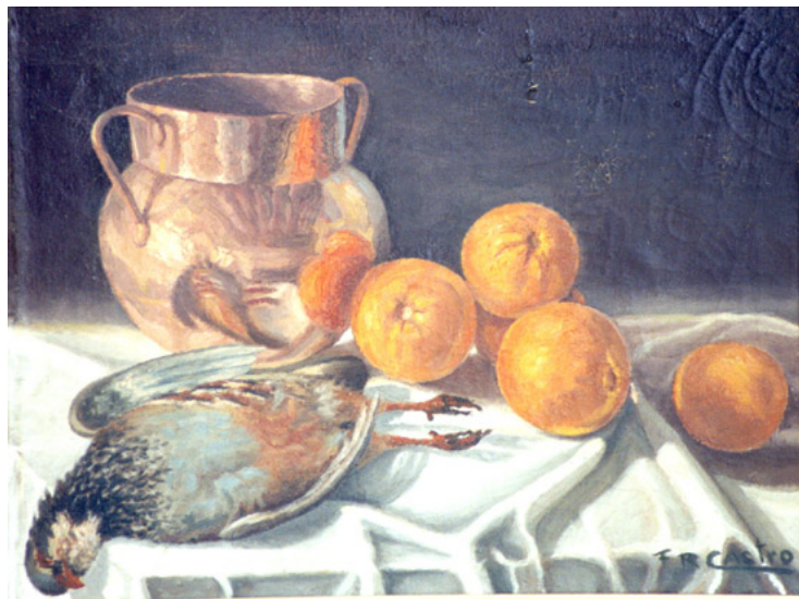
Dibujo a carboncillo y bodegón de Francisco Ruiz Castro