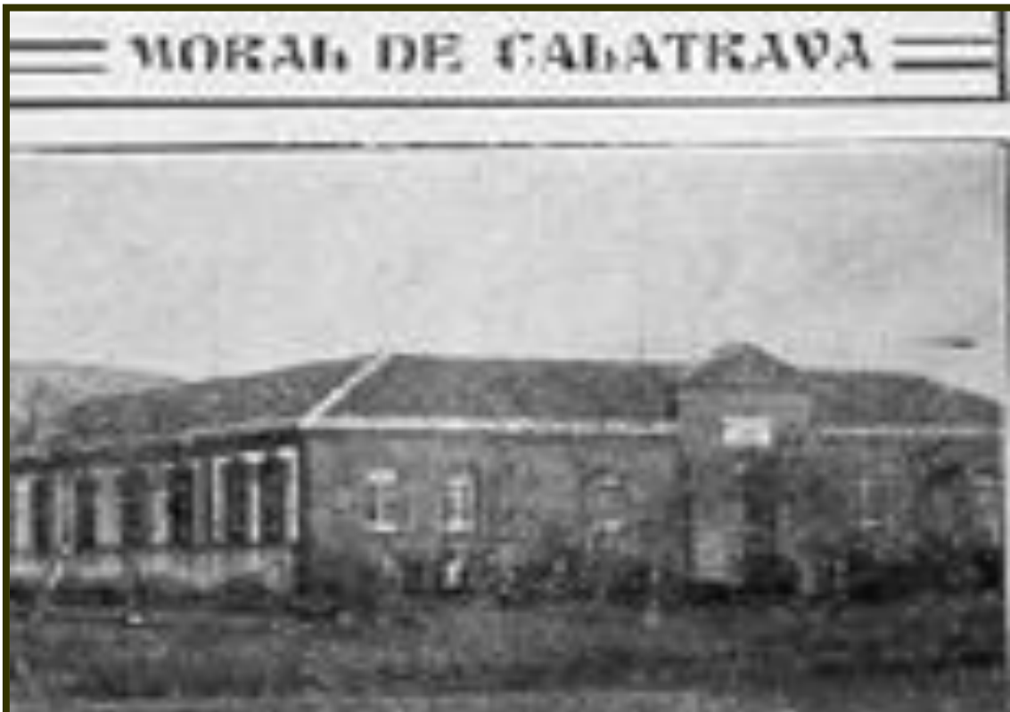
GRUPO ESCOLAR DEL ASILO. Recién construido en 1905