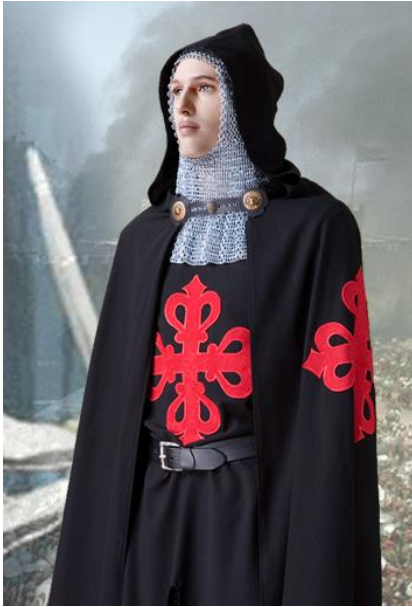
Réplica actual de la Túnica de los Frailes Guerreros de la Orden de Calatrava