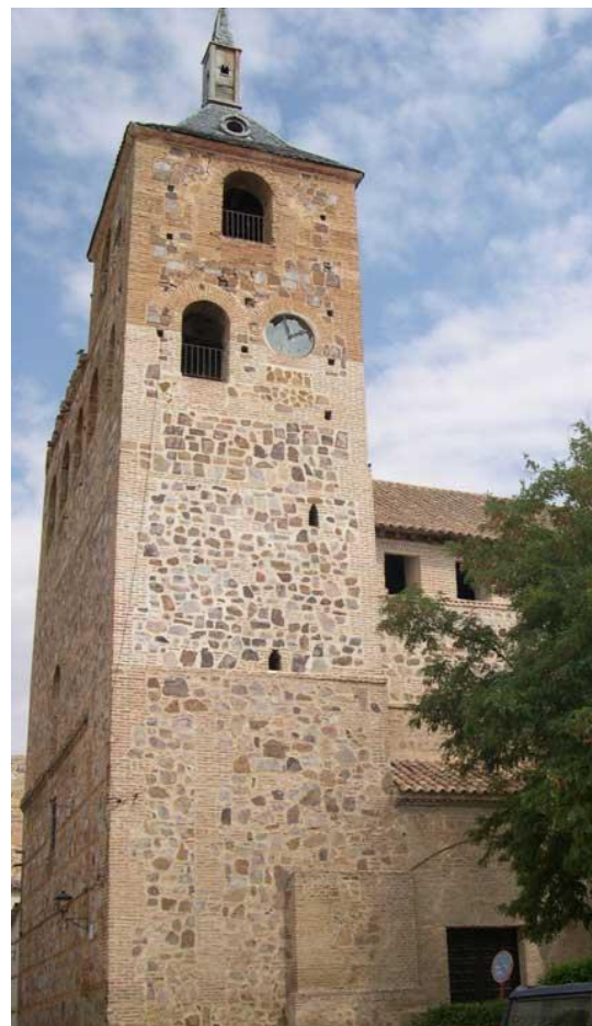
Torre Iglesia de San Andrés Moral de Calatrava

Hay un dato significativo que salta a la vista en El Moral de Calatrava, con relación a la mayoría de los pueblos de la zona, y es que hay una total ausencia de fortalezas o castillos, en su término, que sirvieran como refugio o defensa de la población, tan solo se conservan restos de una torre vigía del Castillo de “La Mesnera”, situado en el cerro homónimo y perteneciente a la extinta Encomienda de Moratalaz. En la provincia de Ciudad Real se pueden contabilizar actualmente cuarenta y cuatro fortificaciones entre castillos, alcazabas, alcázares, atalayas y torres, todas de la época de la reconquista y que eran tanto de construcción