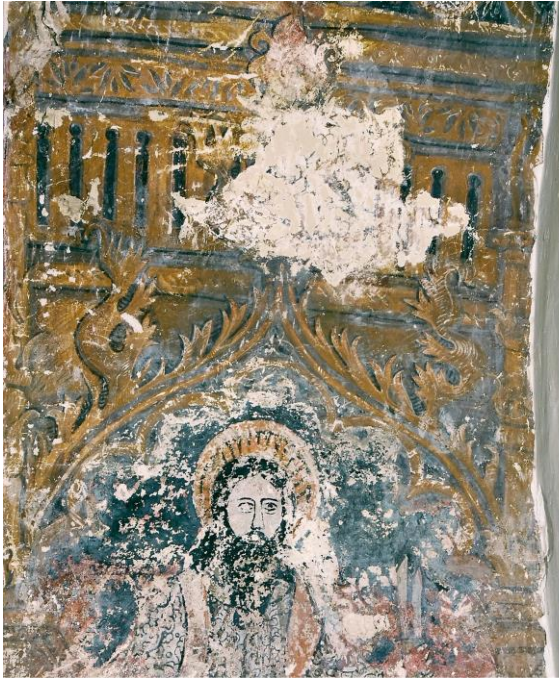
Pinturas Góticas del Siglo XV Interior de la Iglesia Parroquial

cristiana como musulmana. En el casco urbano de Moral de Calatrava tan solo se conservan algunos elementos arquitectónicos de siglos anteriores en la estructura de la torre de la iglesia parroquial, lo que da lugar a especular que fuese algún tipo de minarete o torre vigía, antes de convertirse en templo dedicado al culto. Aunque la construcción propiamente dicha como iglesia parroquial es muy probable que date de este siglo, ya que en su interior existen frescos góticos de esa época y que los arqueólogos los han datado de la segunda mitad del siglo XV. Hace ya varios años hubo un primer descubrimiento de este tipo de