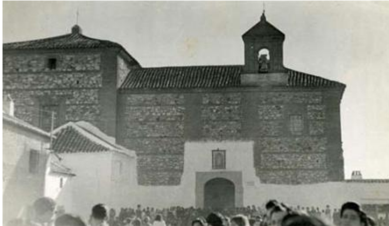
Ermita del Cristo de la Humildad. Foto de 1940 Se empezó a construir el 14 de mayo de 1625

esperaban mejorar su calidad de vida; pero allí, en la mayoría de los casos, se vieron abocados a la mendicidad o a la delincuencia.