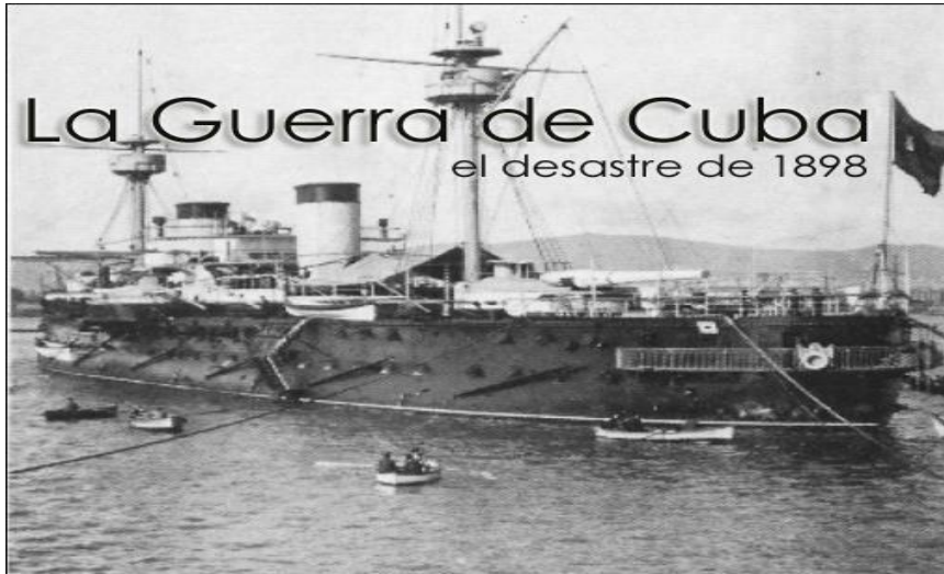
Acorazado Pelayo Guerra de 1898 Hispano- Americana Isla de Cuba