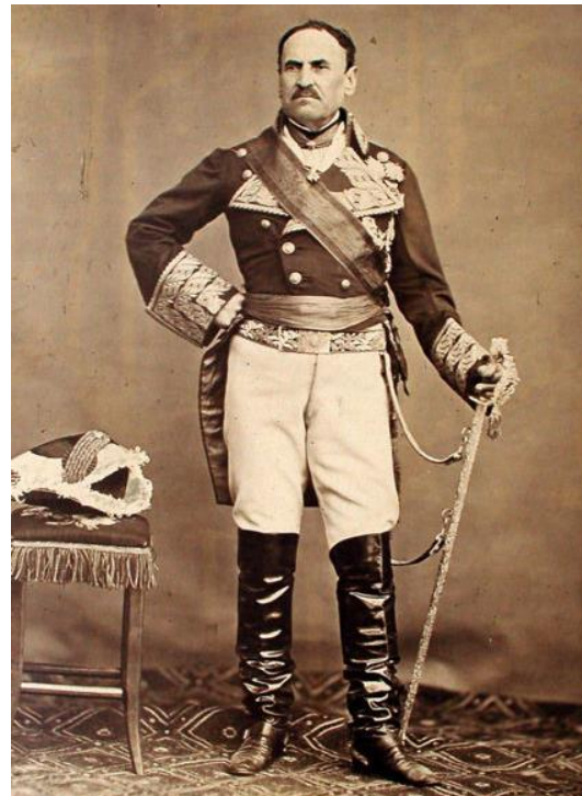
Baldomero Espartero.