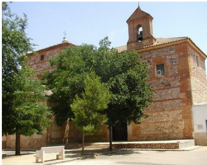
Ermita del Santísimo Cristo de la Humildad. Antigua iglesia del Convento de los Franciscanos del Santo Ángel. Siglo XVII.

padres Franciscanos. Aunque esta situación no restó fervor religioso en los jóvenes de Moral, si no por el contrario incentivó a que muchos de ellos pasaran a engrosar las listas de seminarios y conventos; tal es así que