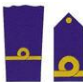
Distintivos de Alferez de Navío