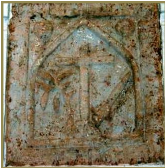
Escudo de la Inquisición ubicado en Moral de Calatrava

de otros cargos. El 19 de octubre de 1796 fue elegido Rector del Seminario Conciliar de Méjico.