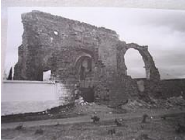
Desaparecidas ruinas del viejo convento de los agustinos en El Toboso (Toledo)