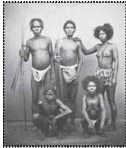
Indígenas de la Isla de Luzón, de las zonas de misiones que tenían los recoletos.

Los agustinos recoletos fueron la última de las congregaciones religiosas que llegaron a Filipinas en el año de 1606. Esto implicó que, siendo de entre las grandes órdenes evangelizadoras de Filipinas los últimos en llegar, se les adjudicase casi siempre la administraron de las zonas más pobres de las Islas y muchas veces los lugares que las otras órdenes no querían. Así, a los descalzos de San Agustín les tocó casi siempre misionar en zonas muy peligrosas y expuestas a los ataques de los piratas malayo-mahometanos en Mindanao y Palawan, o en las zonas más agrestes de los montes de la isla de Luzón.