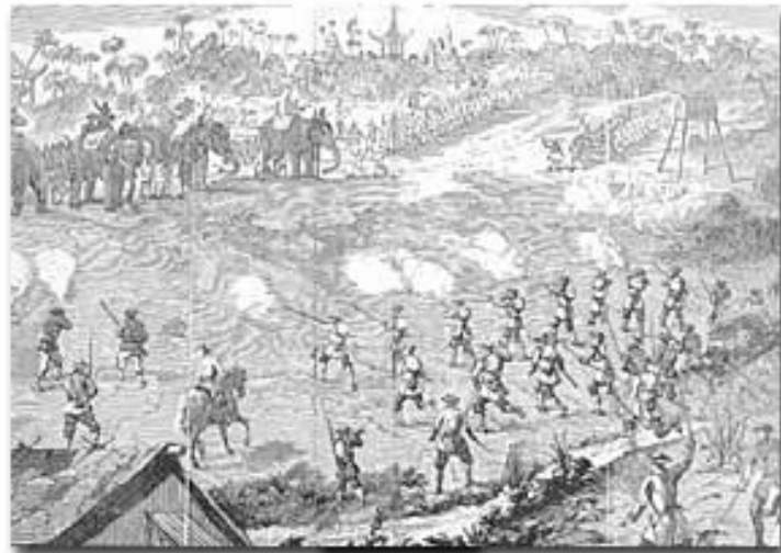
Grabado de batalla en la Conchinchina contra tropas autóctonas a lomos de elefantes

donde resulto muerto el usurpador Rey Prabantul, por un tiro de arcabuz. La multitud enfurecida se lanzó en persecución de los soldados y frailes españoles, la mayoría pudieron huir hacia el río Mekong, una vez allí consiguieron embarcar en varios juncos. En su desesperada huida, por el río, se encontraron con el Capitán Suarez Gallinato, que había reparado su