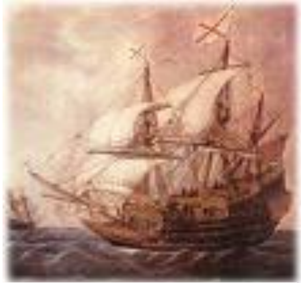
BARCO DEL SIGLO XVI

Con tan solo 18 años parte hacia Nueva España (Méjico), allí se casa con una rica heredera, consiguiendo de esta forma una gran fortuna. En el año 1592, el ya ascendido a Capitán de navío puso rumbo, desde las Américas hacía el archipiélago filipino, en busca de nuevas experiencias y aventuras. Una vez en Filipinas reclutó tropa y salió en dirección de tierras de la Conchinchina. Rondaba el año 1595 y el reino de Camboya andaba con