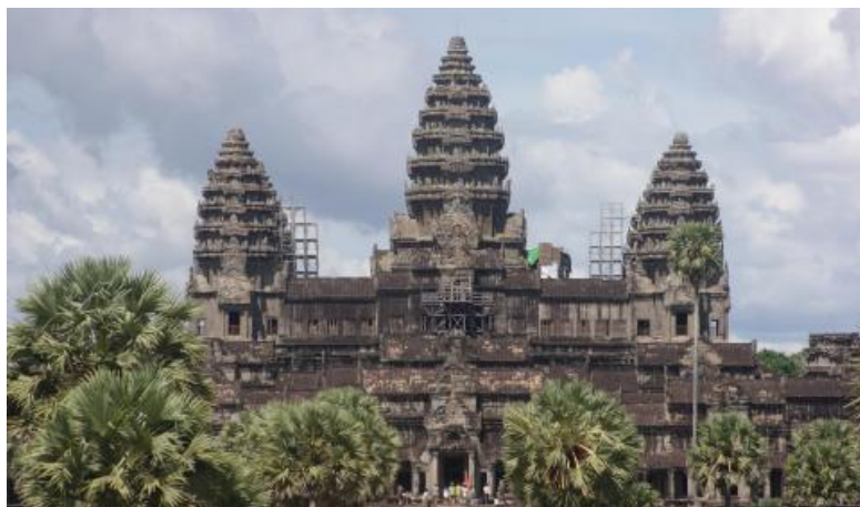
Templo de la Ciudad de Angkor (Camboya)