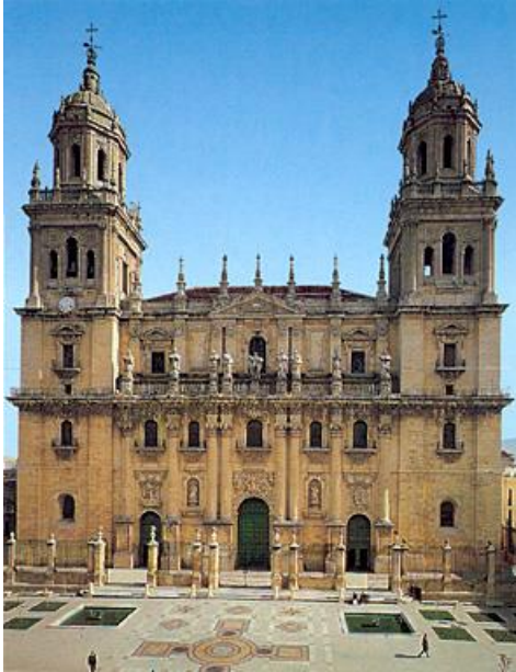
CATEDRAL DE JAEN