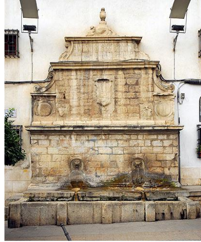
FUENTE DEL ARRABALEJO. 1574