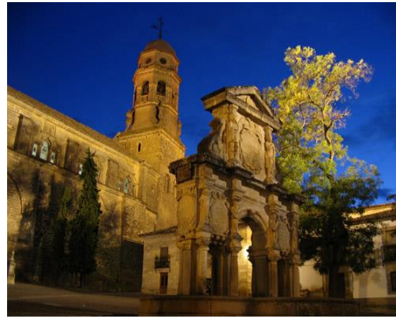
CATEDRAL DE BAEZA

Su primer trabajo como arquitecto data de 1547, con 22 años, con una tasación de las Salinas de la Pinilla en Alcaraz junto al gran arquitecto local Andrés Vandelvira. A partir de este momento Vandelvira y Barba iniciaron una gran relación de amistad y de maestro y discípulo. En 1553 de la mano de Andrés Vandelvira se traslada a Jaén, donde ambos alquilan una casa, y formalizan el contrato de las obras de construcción de la Catedral de Jaén.