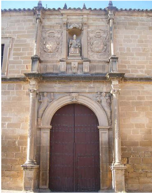
Pórtico meridional de San Pedro en Úbeda