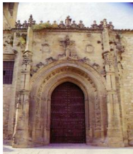
SAN ISIDORO DE UBEDA