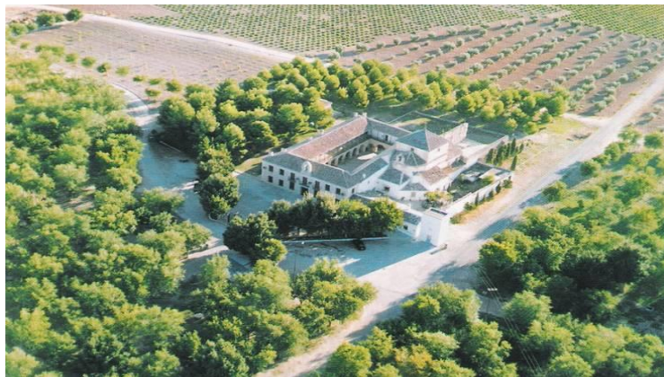
SANTUARIO DE LA VIRGEN DE LAS CRUCES