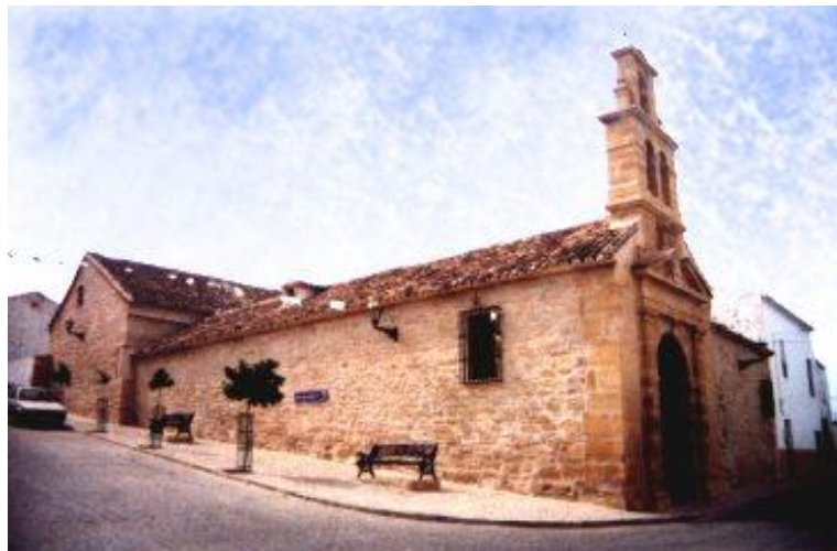
Iglesia San Benito Porcuna (Jaén), Orden Calatrava donde fue enterrado, primeramente, D. Rodrigo

El Gran Maestre de la Orden de Calatrava D. Rodrigo Téllez-Girón murió en la batalla de Loja el 13 de julio de 1482, al ser alcanzado en el costado por dos flechas envenenadas, luchando valerosamente contra los moros del Reino de Granada. Existen 14 poemas de este hecho en el archivo de Granada. Cuando Don Rodrigo murió estuvo