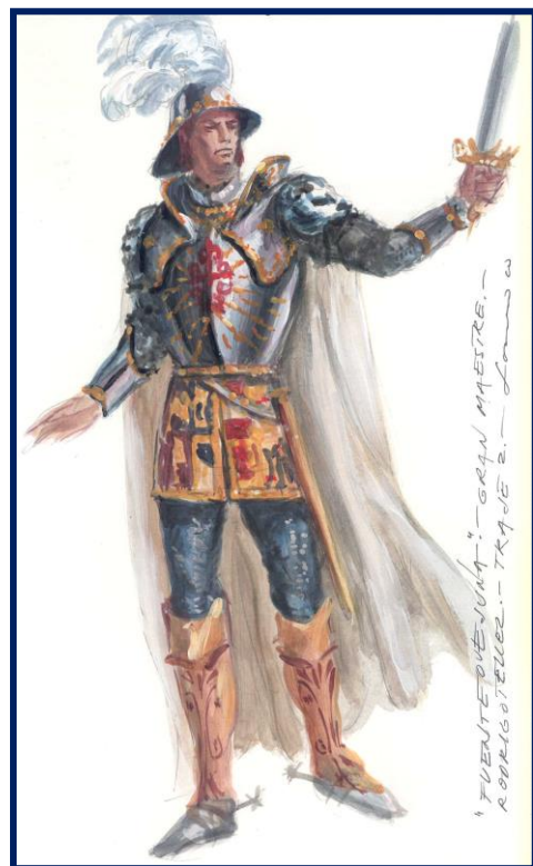
Boceto del traje de D. Rodrigo Téllez Girón Para la obra de Fuenteovejuna

D. Pedro Girón cedió a su hijo Rodrigo el maestrazgo de la Orden en 1464, con tan solo 8 años, para así poder casarse con Isabel La Católica, heredera del trono de Castilla, pero cuando se iba a reunir con ella murió, inesperadamente, en Villarrubia de los Ojos (Ciudad Real) el día 2 de mayo de 1466. D. Rodrigo Téllez-Girón fue nombrado entonces Gran Maestre de la Orden de Calatrava, siendo coadjutor su tío D. Juan Pacheco (Marqués de Villena y Gran Maestre de la orden de Santiago), trasladándolo a Almagro para ser educado por los frailes. Durante su mandato se realizaron las primeras definiciones de la Orden de Calatrava por el Abad Frey Guillermo en el año 1468. En estos primeros años no interfirió en la vida política y militar de la Orden de Calatrava, fue a raíz de la