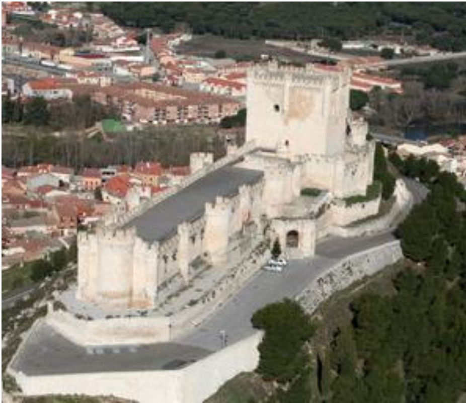
Vista aérea del Castillo de Peñafiel, Valladolid. Propiedad de la familia Téllez- Girón.

Habiendo fallecido su padre, Pedro Girón en 1466, había dejado la tutela y el poder a su tío D. Juan Pacheco (Marqués de Villena) para otorgar testamento y cesión de todos los títulos a su hermano menor, y tercero de la dinastía en la línea de sucesión, Juan Téllez Girón; ya que su otro hermano Rodrigo Téllez-Girón había heredado el título de Gran Maestre de la Orden de Calatrava.