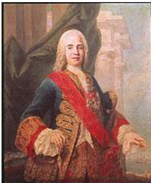
Cenón de Somodevilla y Bengoechea, Marqués de la Ensenada