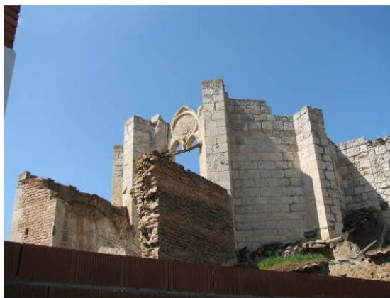
Actual estado del convento de San Francisco de Peñafiel

Poco podemos decir de este personaje, salvo que fue designado heredero por su padre en sus principales bienes y oficios, entre los que se encontraba el de Notario Mayor de Castilla y Camarero Mayor de la Cámara de Paños, según consta en el testamento otorgado por D. Pedro Girón el día 28 de abril de 1466 en Villarrubia de los Ojos. Poco antes de morir, Don Pedro Girón, había obtenido el 25 de mayo de 1464, del Rey Enrique IV, para su hijo primogénito el título de Primer Conde de Ureña ó Uruña (villa cercana a Valladolid), y tras unas complejas transacciones,