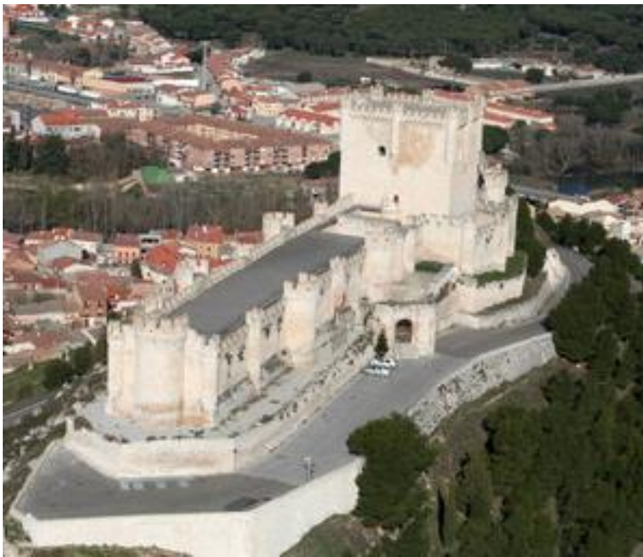
Vista aérea del Castillo de Peñafiel, Valladolid. Propiedad de la familia Téllez-Girón.

Habiendo fallecido su padre, Pedro Girón en 1466, había dejado la tutela y el poder a su tío D. Juan Pacheco (Marqués de Villena) para otorgar testamento y cesión de todos los títulos a su hermano menor, y tercero de la dinastía en la línea de sucesión, Juan Téllez Girón; ya que su otro hermano Rodrigo Téllez-Girón había heredado el título de Gran Maestre de la Orden de Calatrava.